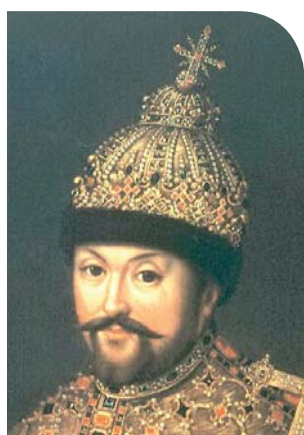
Михаил Фёдорович Романов (1596-1645) Первый русский царь из династии Романовых