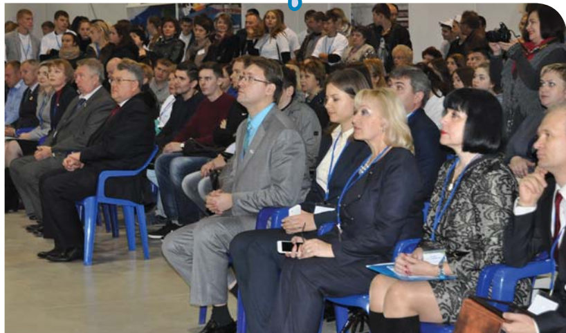
Все замерли в ожидании СУПЕР ШОУ!