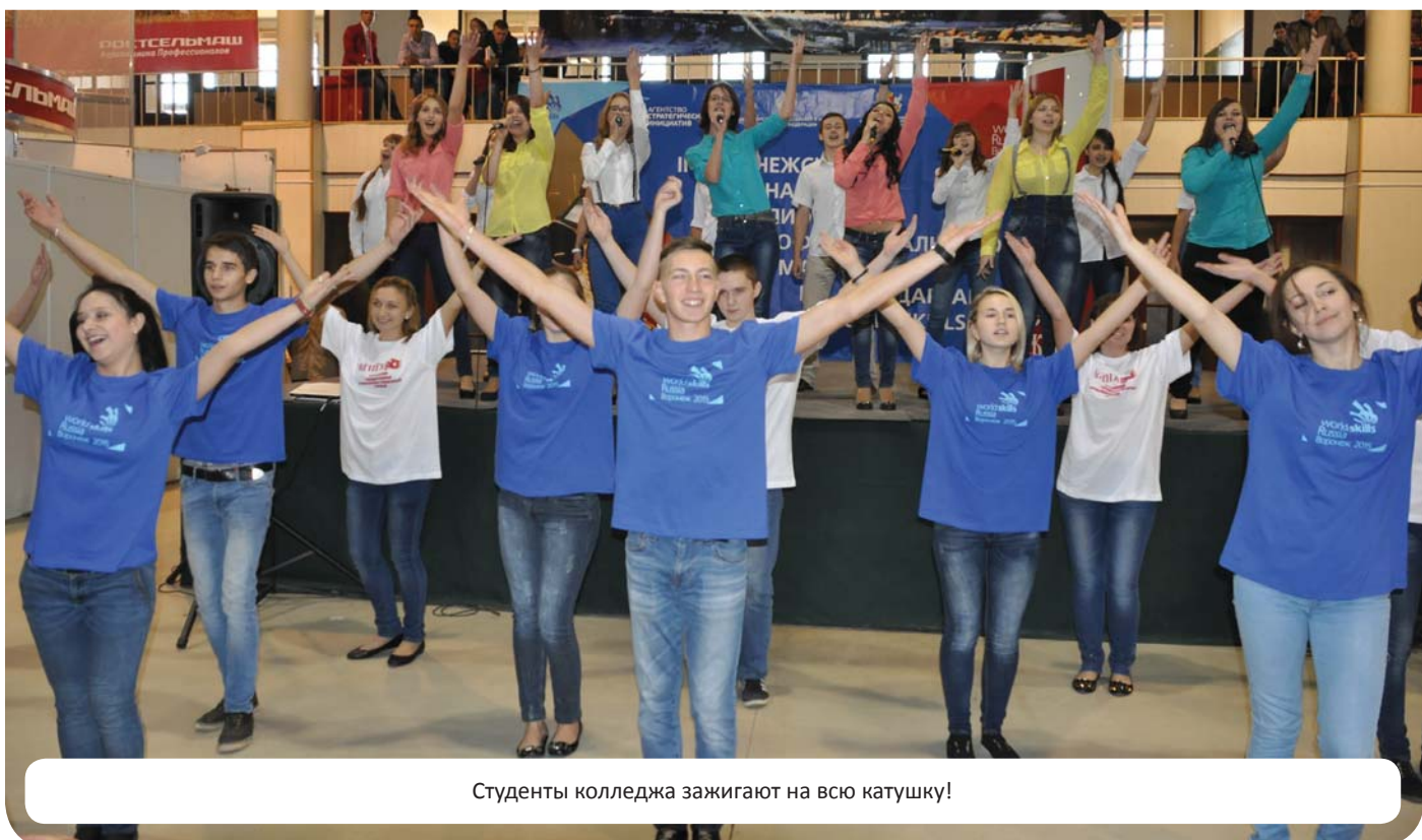
Студенты колледжа зажигают на всю катушку!