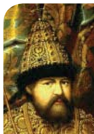
Алексей Михайлович Тишайший (1629-1676) Второй русский царь из династии Романовых