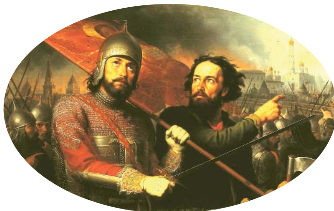
М. И. Скотти. «Минин и Пожарский» (1850). Красное знамя с иконой, которое несёт князь, исторически достоверно.